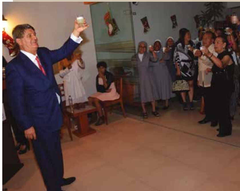
21 de diciembre de 2016 – Un brindis por la Navidad.

“Al cumplirse una década de los servicios prestados en el Consulado General Honorario de Filipinas en el Perú, estimo