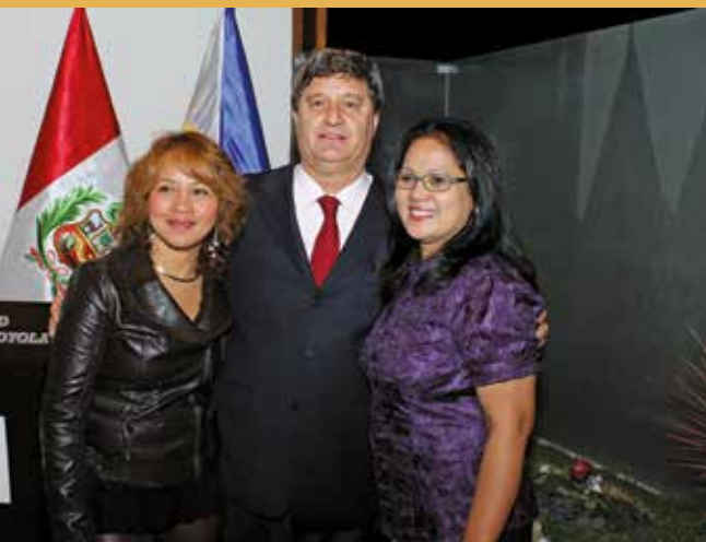
20 de diciembre de 2012 – Brindis por la Navidad.