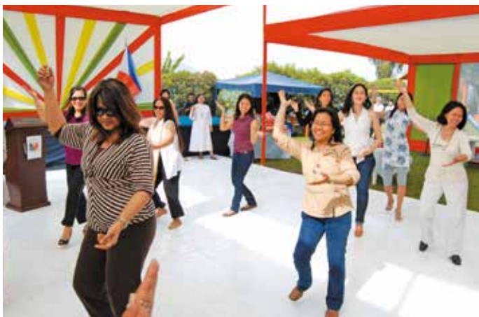
6 de diciembre de 2009 – Miembros de la comunidad filipina bailando animadamente la danza del Pandango.