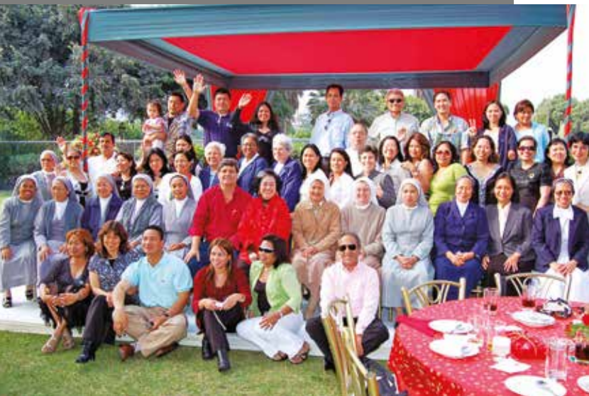
15 de diciembre de 2007 – Miembros de la comunidad filipina que asistieron a nuestra celebración de la Navidad.