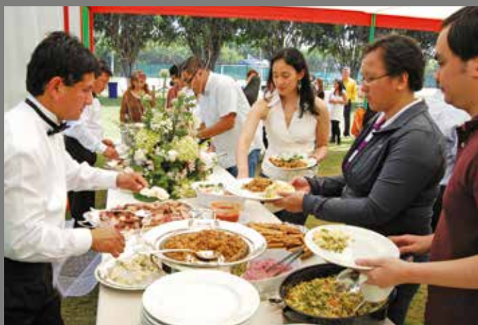
6 de diciembre de 2009 – Almuerzo navideño ofrecido por el Consulado General Honorario.