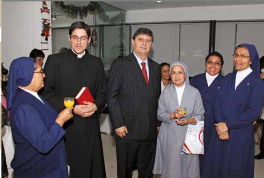
20 de diciembre de 2012 – Miembros de la Iglesia Católica siempre asisten a nuestras celebraciones.