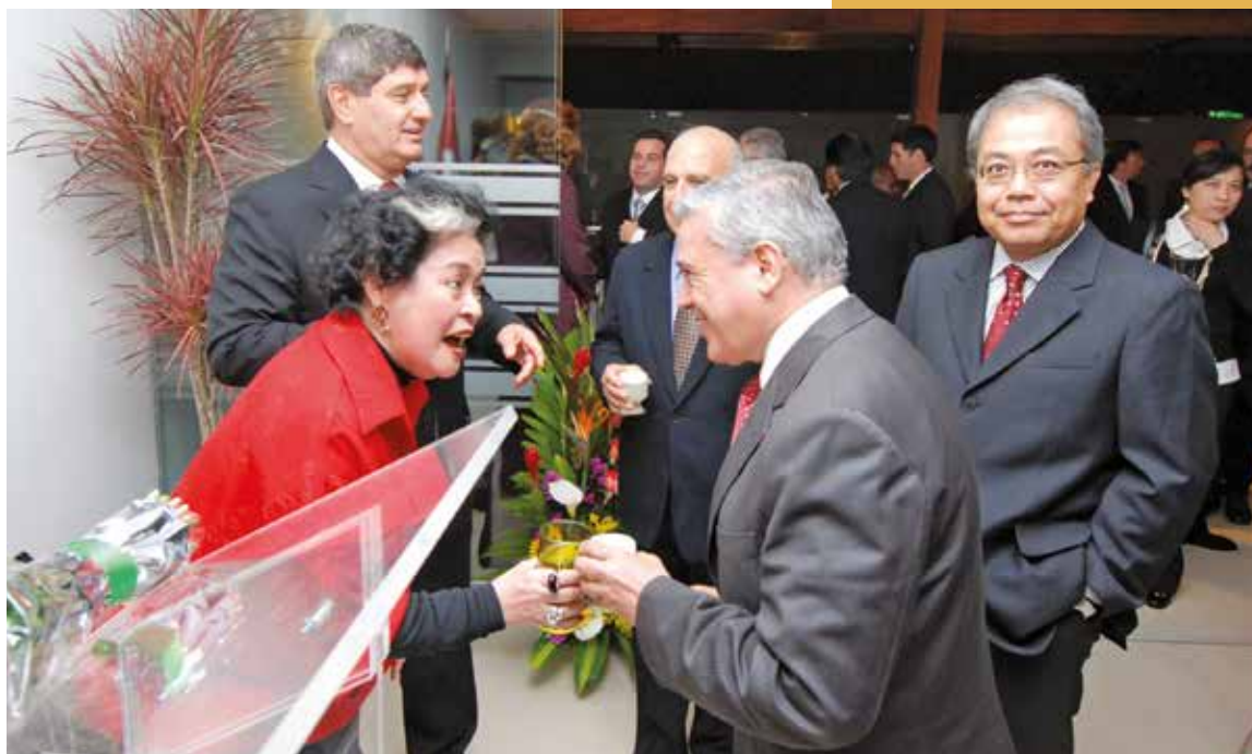
25 de junio de 2010 – Integrantes del cuerpo diplomático y distinguidos miembros de la comunidad filipina en el Perú asistieron a esta fiesta de despedida.