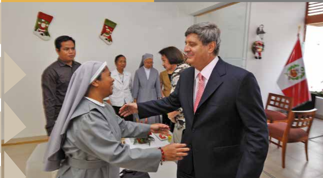
23 de diciembre de 2011 – Cónsul General Honorario Raúl Diez Canseco Terry recibiendo a nuestros invitados filipinos.