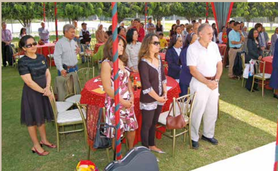
15 de diciembre de 2007 – Cerca de 80 miembros de nuestra comunidad filipina asistieron a la reunión navideña. Se informó a los invitados sobre la visita de la presidenta Gloria Macapagal-Arroyo con motivo de la Cumbre de Líderes APEC 2008.