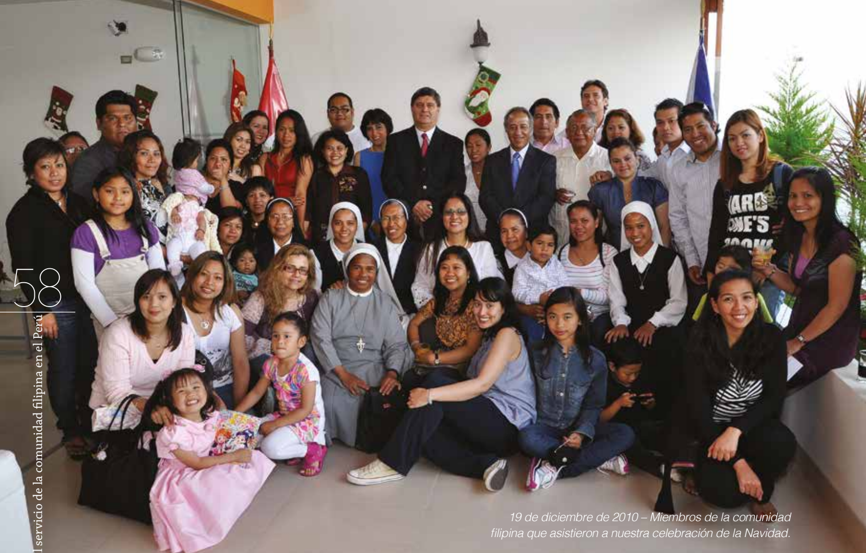
19 de diciembre de 2010 – Miembros de la comunidad filipina que asistieron a nuestra celebración de la Navidad.

Al finalizar este año había 30 ciudadanos filipinos que cumplían sentencia en el Perú (26 mujeres en Chorrillos, tres varones en el Callao y uno en Cusco). En julio, tuvimos el primer caso de una ciudadana filipina cumpliendo condena en Chorrillos que dio a luz a una niña, quien pudo permanecer con su madre en el penal de Santa Mónica, en Chorrillos.