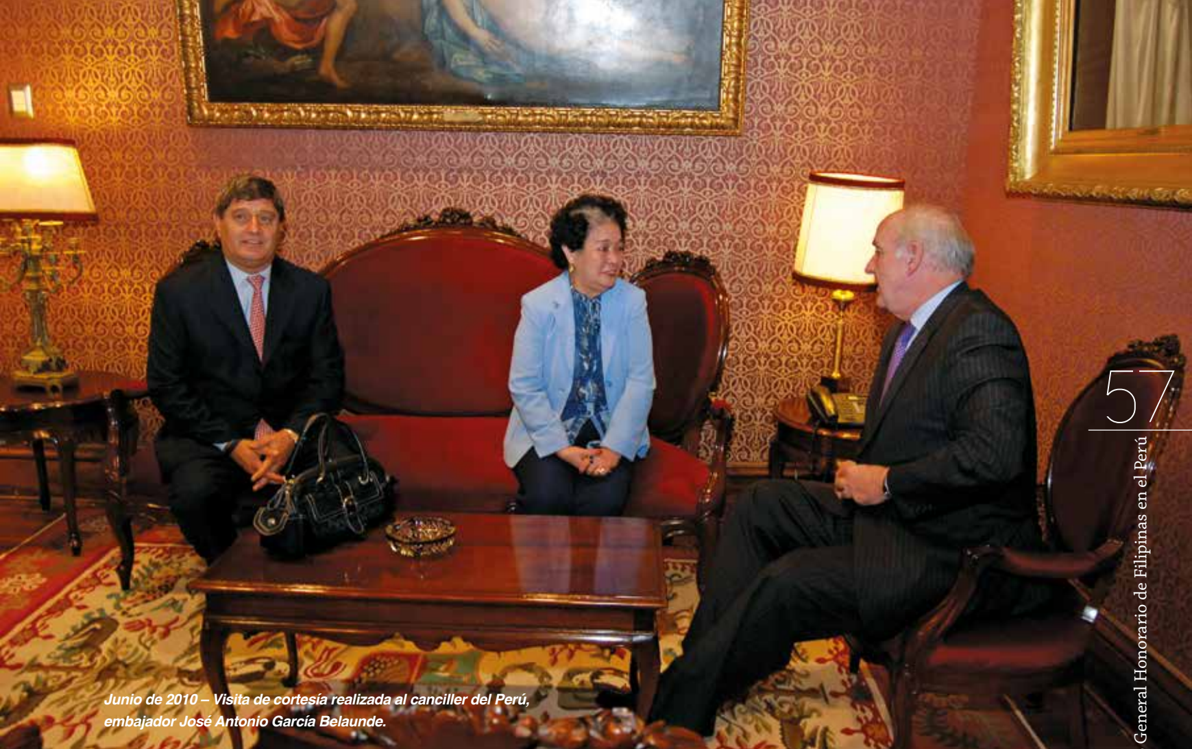
Junio de 2010 – Visita de cortesía realizada al canciller del Perú, embajador José Antonio García Belaunde.