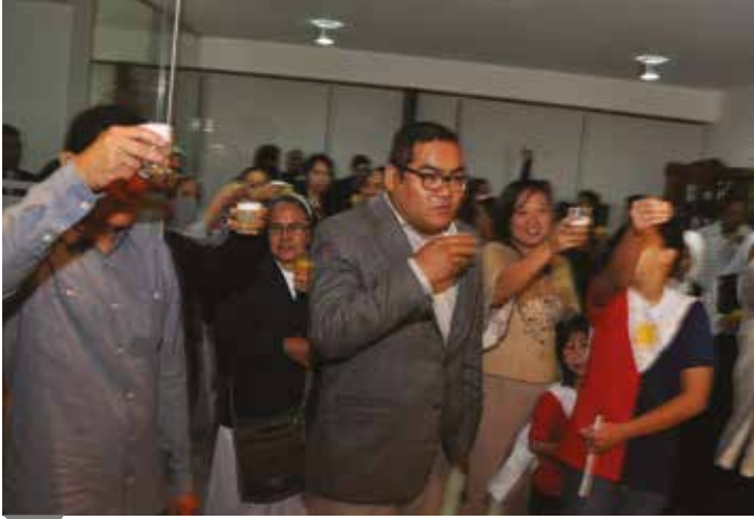
12 de junio de 2015 – Brindando por el Día de la Independencia.