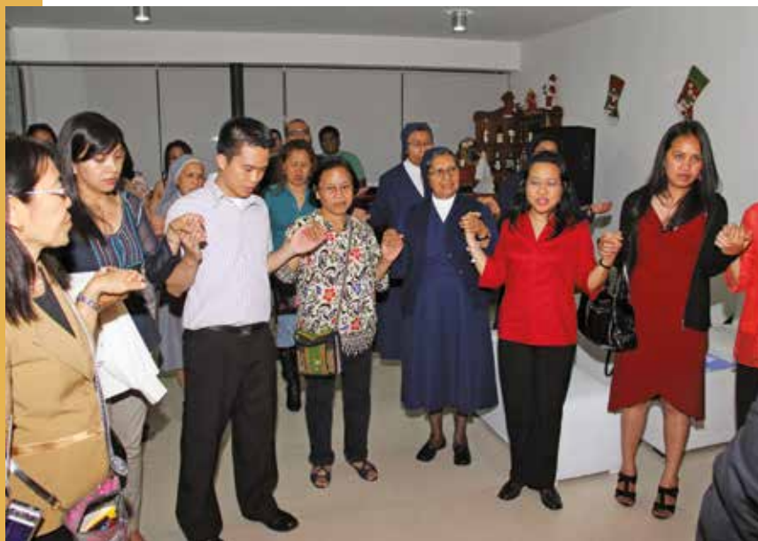
20 de diciembre de 2012 – Todos uniendo sus manos en la oración.

en el Perú. Cuatro ciudadanas que se encontraban en libertad condicional lograron que el Ministerio de Justicia conmutara su sentencia. Asimismo, siete que cumplían su condena en prisión también lograron que dicho ministerio conmutara su sentencia.