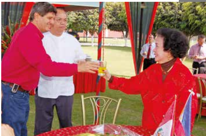
15 de diciembre de 2007 – Brindis navideño.