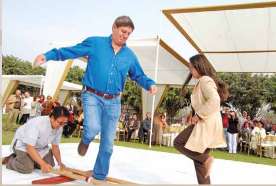
13 de junio de 2009 – El baile del Tinikling.