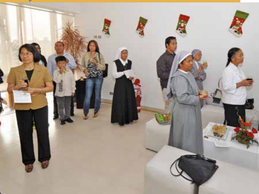
23 de diciembre de 2011 – Miembros de la comunidad filipina escuchando el mensaje navideño.

tema de la situación de los ciudadanos extranjeros cumpliendo sentencia en el Perú. En dicho taller se informó acerca de la simplificación de los procedimientos para el otorgamiento de conmutaciones a los ciudadanos extranjeros sentenciados.