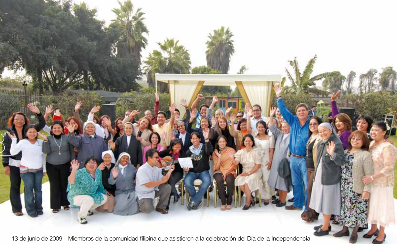
13 de junio de 2009 – Miembros de la comunidad filipina que asistieron a la celebración del Día de la Independencia.