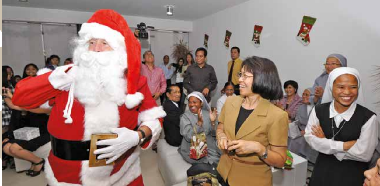
23 de diciembre de 2011 – Santa Claus nos visitó durante nuestra celebración de la Navidad.