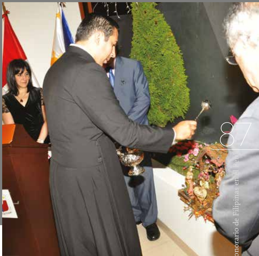
16 de diciembre de 2015 – Bendición del Nacimiento.