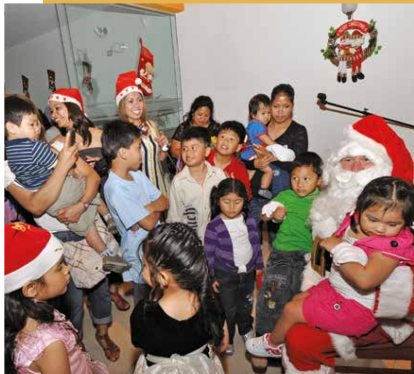
23 de diciembre de 2011 – Niños filipinos rodean a Santa Claus durante la celebración de la Navidad.

Se asistió a un taller, organizado por el Ministerio de Relaciones Exteriores y el Ministerio de Justicia del Perú, para tratar el