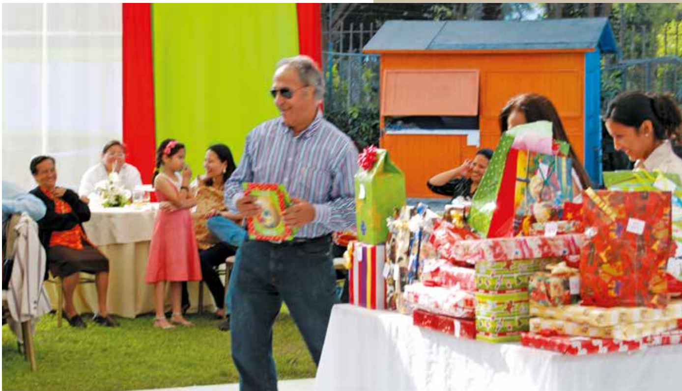
6 de diciembre de 2009 – Intercambio de regalos navideños.