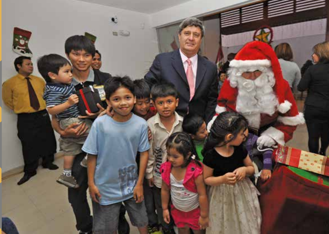
23 de diciembre de 2011 – Santa Claus trajo alegría y felicidad a nuestros niños filipinos.