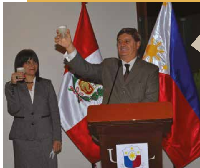
9 de junio de 2016 – Cónsul General Honorario Raúl Diez Canseco Terry proponiendo un brindis por el Día de la Independencia.

Durante este año, una mujer filipina fue puesta en libertad condicional. Al finalizar el año había ocho ciudadanos filipinos cumpliendo sentencia en el Perú (cinco mujeres en Ancón, dos varones en el Callao y una mujer en Cusco).