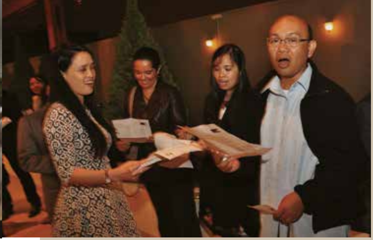
12 de junio de 2015 – Miembros de la comunidad filipina entonando canciones populares de su país durante nuestra celebración por el Día de la Independencia.