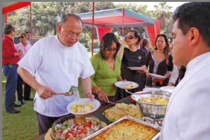
15 de diciembre de 2007 – Se sirvieron platos típicos filipinos a nuestros invitados.