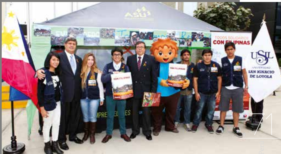
Noviembre de 2013 – El Consulado General Honorario de Filipinas en el Perú, Cáritas del Perú y la Universidad San Ignacio de Loyola coordinaron esfuerzos orientados a la recaudación de fondos para las víctimas del tifón 'Yolanda'.