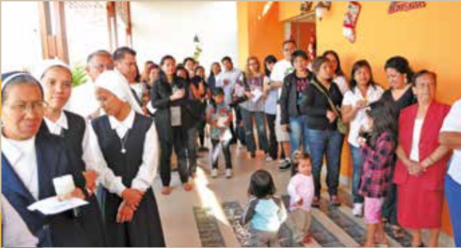
19 de diciembre de 2010 – Nuestros invitados filipinos.