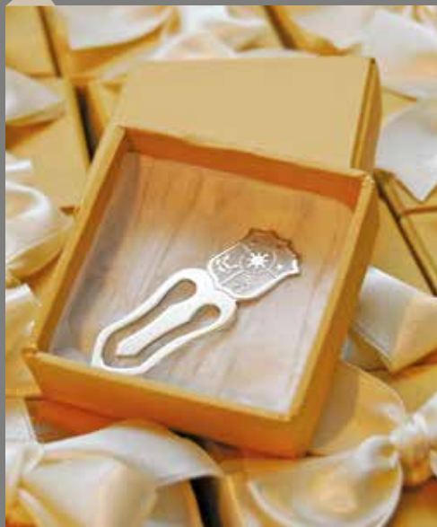
10 de junio de 2008 – Nuestros invitados recibieron marcadores de libros con el escudo de armas de Filipinas.

en el distrito de Miraflores. Asimismo, visitaron las instalaciones de la Universidad San Ignacio de Loyola, donde se realizaría la ceremonia de otorgamiento del grado de Doctor Honoris Causa a la presidenta Macapagal-Arroyo. Luego de ello, los delegados de OP visitaron el parque ubicado en el distrito de La Molina donde se instalaría el busto de José Rizal.