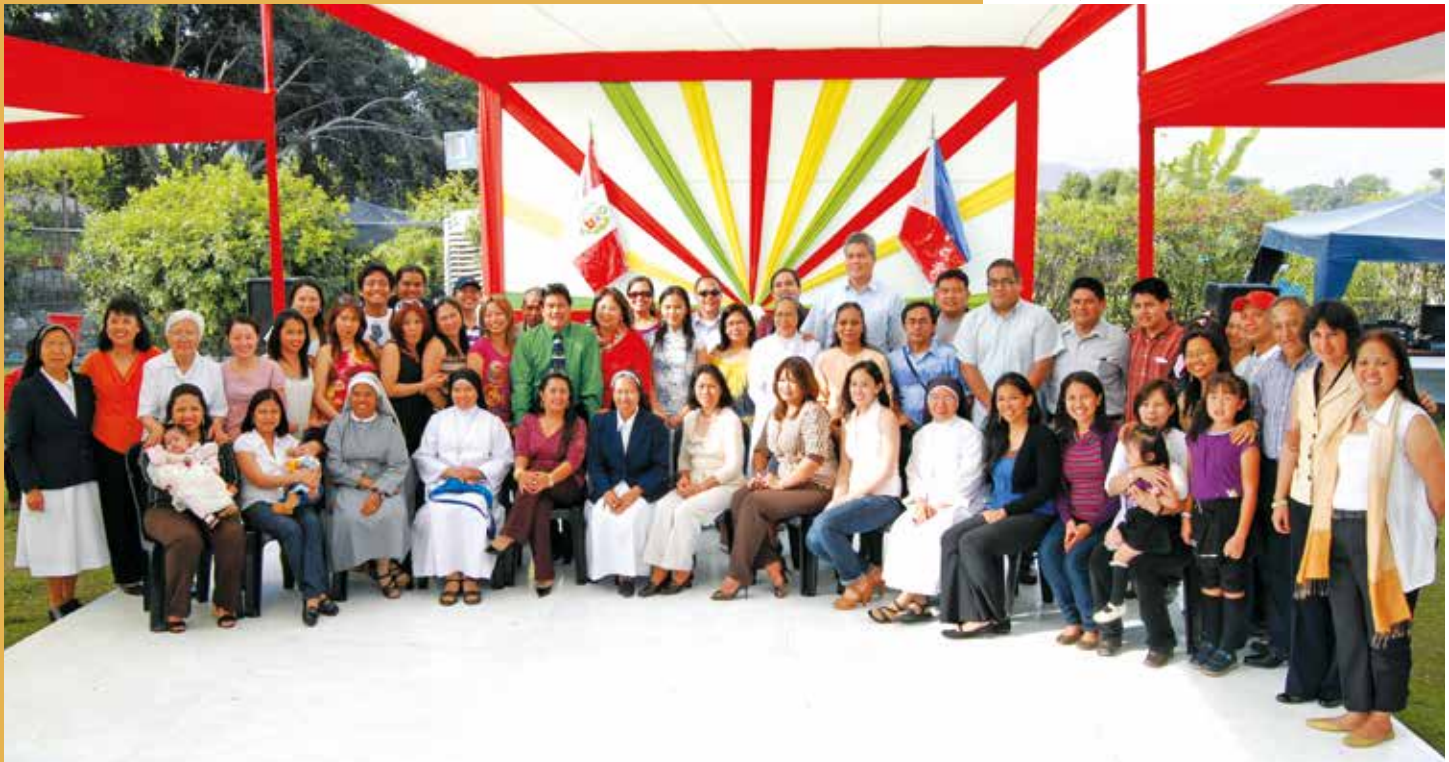
6 de diciembre de 2009 – Miembros de la comunidad filipina que asistieron a nuestra celebración de la Navidad.