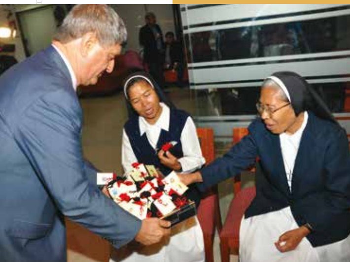
16 de diciembre de 2015 – Nuestros invitados recibieron recuerdos navideños durante nuestra celebración.