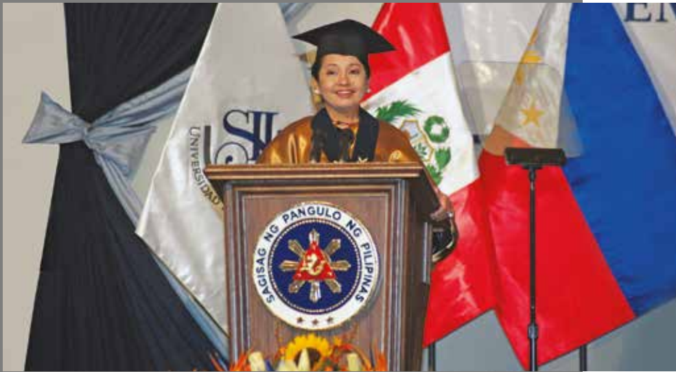
24 de noviembre de 2008 – Presidenta Gloria Macapagal-Arroyo dando una conferencia magistral en la Universidad San Ignacio de Loyola.