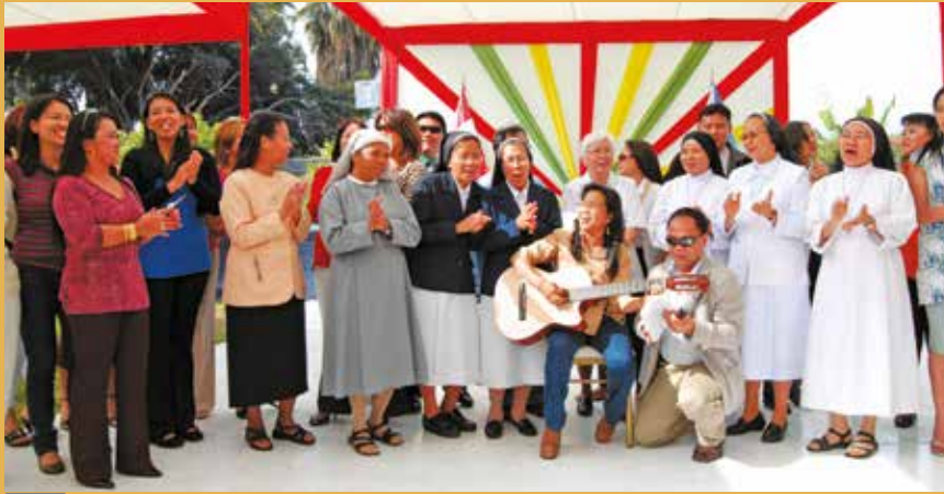
6 de diciembre de 2009 – Miembros de la comunidad filipina cantando villancicos.