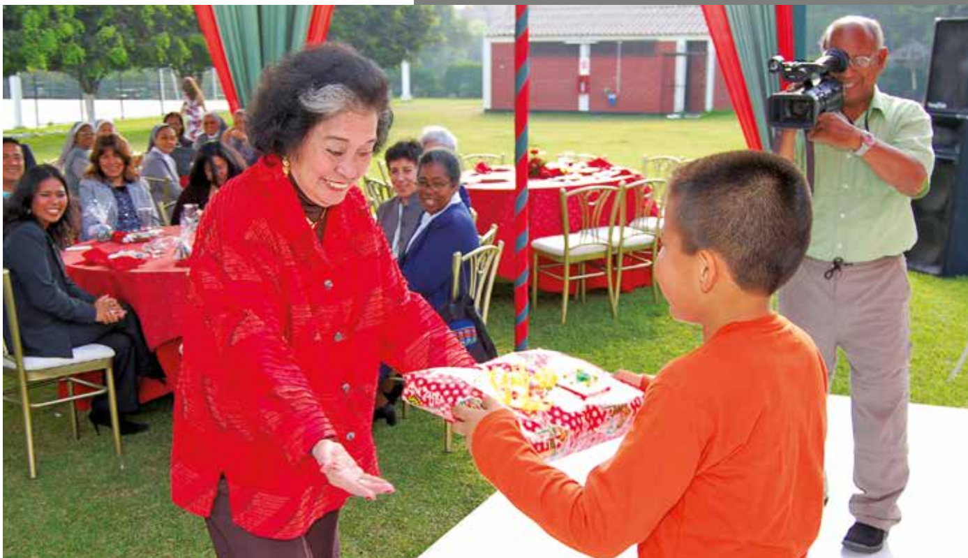
15 de diciembre de 2007 – Intercambio de regalos navideños.