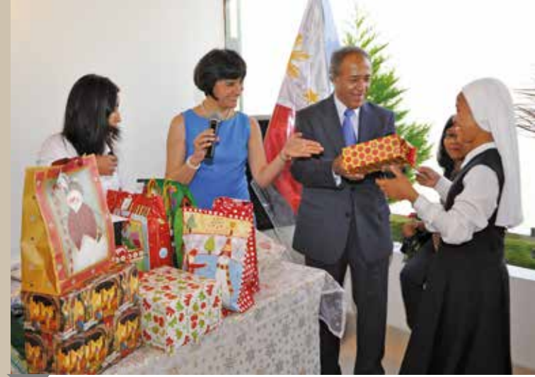
19 de diciembre de 2010 – Intercambio de regalos navideños.