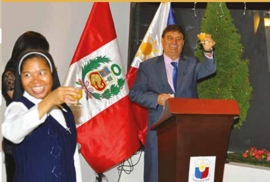
16 de diciembre de 2015 – Un brindis por la Navidad.