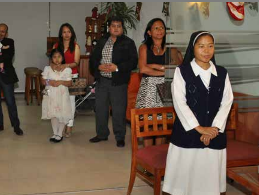
16 de diciembre de 2015 – Miembros de la comunidad filipina escuchando el mensaje navideño.

hospital de Lima. Este Consulado General Honorario preparó el Registro de Fallecimiento y el Certificado Mortuario Consular que acompañaron al conocimiento de embarque en esta repatriación.