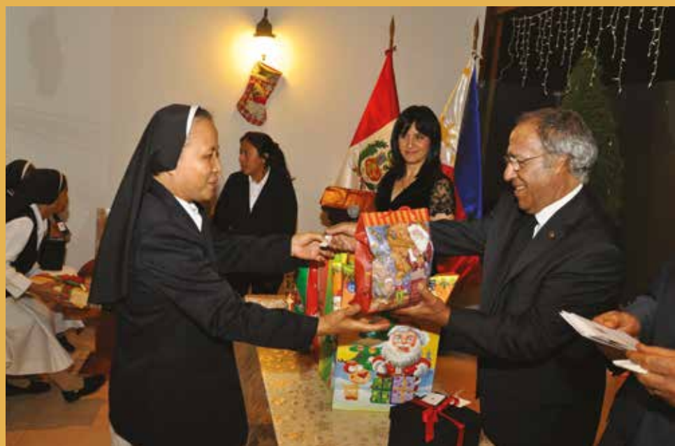
16 de diciembre de 2015 – Intercambio de regalos navideños.