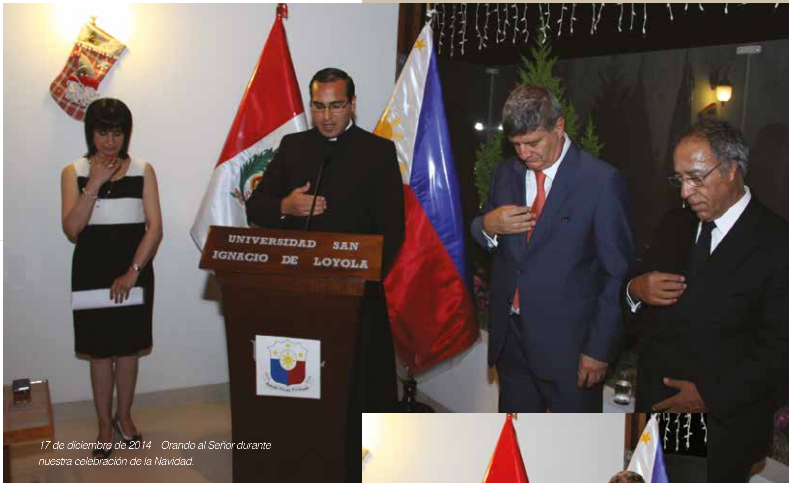
17 de diciembre de 2014 – Orando al Señor durante nuestra celebración de la Navidad.