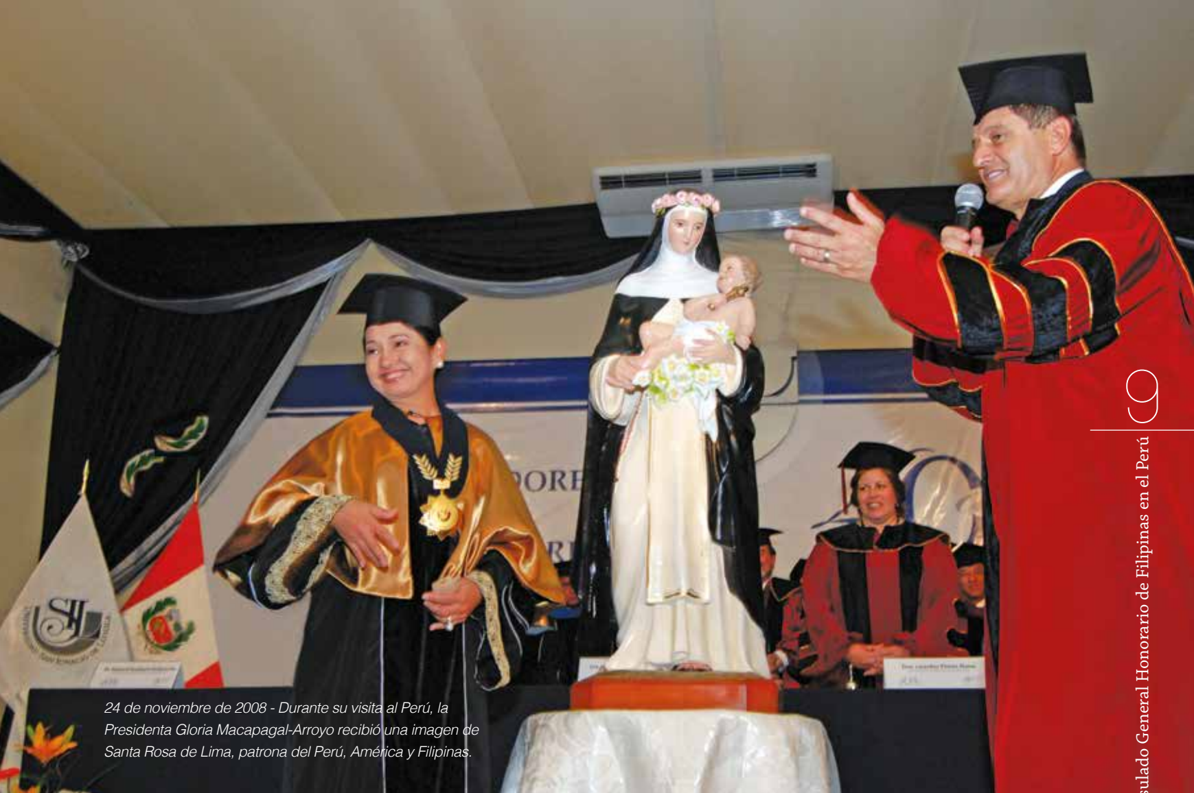
24 de noviembre de 2008 - Durante su visita al Perú, la Presidenta Gloria Macapagal-Arroyo recibió una imagen de Santa Rosa de Lima, patrona del Perú, América y Filipinas.

Solo a través de este proceso es posible descubrir, crear y desarrollar nuevas iniciativas bilaterales, algunas de las cuales ya están en sus etapas iniciales, tales como en el área de las energías renovables.