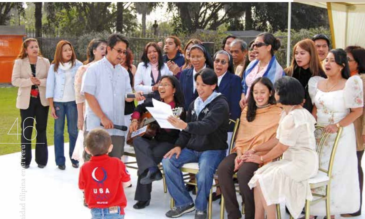
13 de junio de 2009 – Miembros de la comunidad filipina entonando canciones populares de su país.