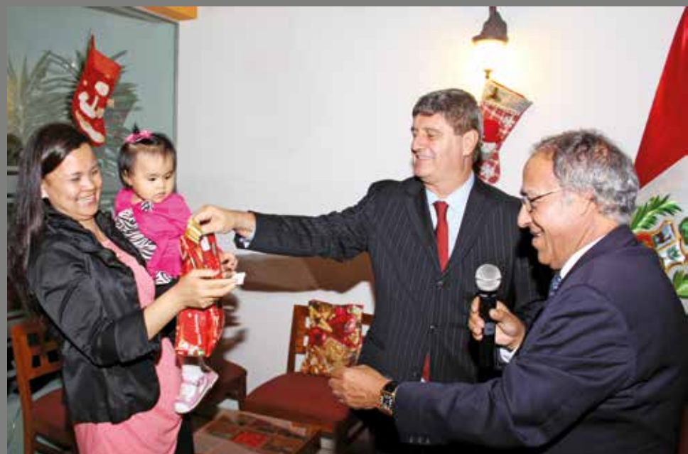
20 de diciembre de 2012 – Intercambio de regalos navideños.