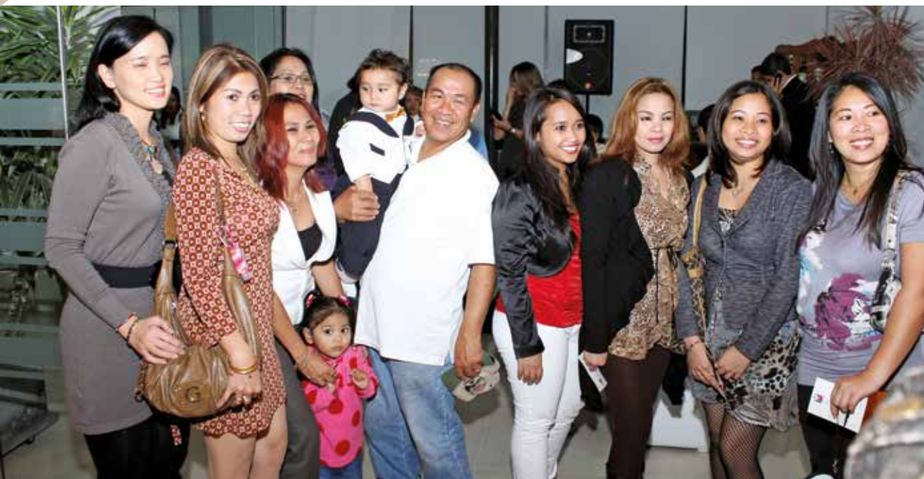
12 de junio de 2012 – Miembros de la comunidad filipina que asistieron a nuestra celebración de la Independencia.