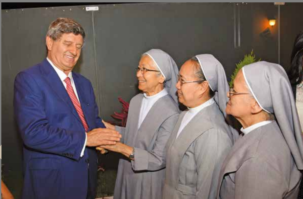
21 de diciembre de 2016 – Compartiendo un lindo momento con nuestras religiosas filipinas de San Pablo de Chartres.