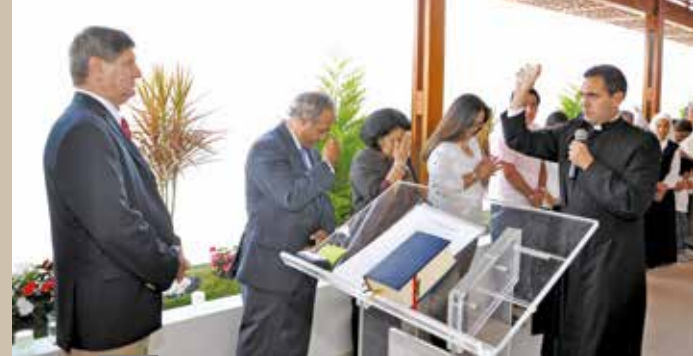
19 de diciembre de 2010 – Recibiendo la bendición.

(09) documentos de viaje, (01) registro de matrimonio, (01) registro de fallecimiento, (01) certificado mortuario consular, (06) visas 9a, (01) visa 9c, (01) visa 9e-2 y (01) visa 9e-3. Este Consulado General Honorario también procesó solicitudes de renovación de pasaporte y de extensión de validez de pasaporte.