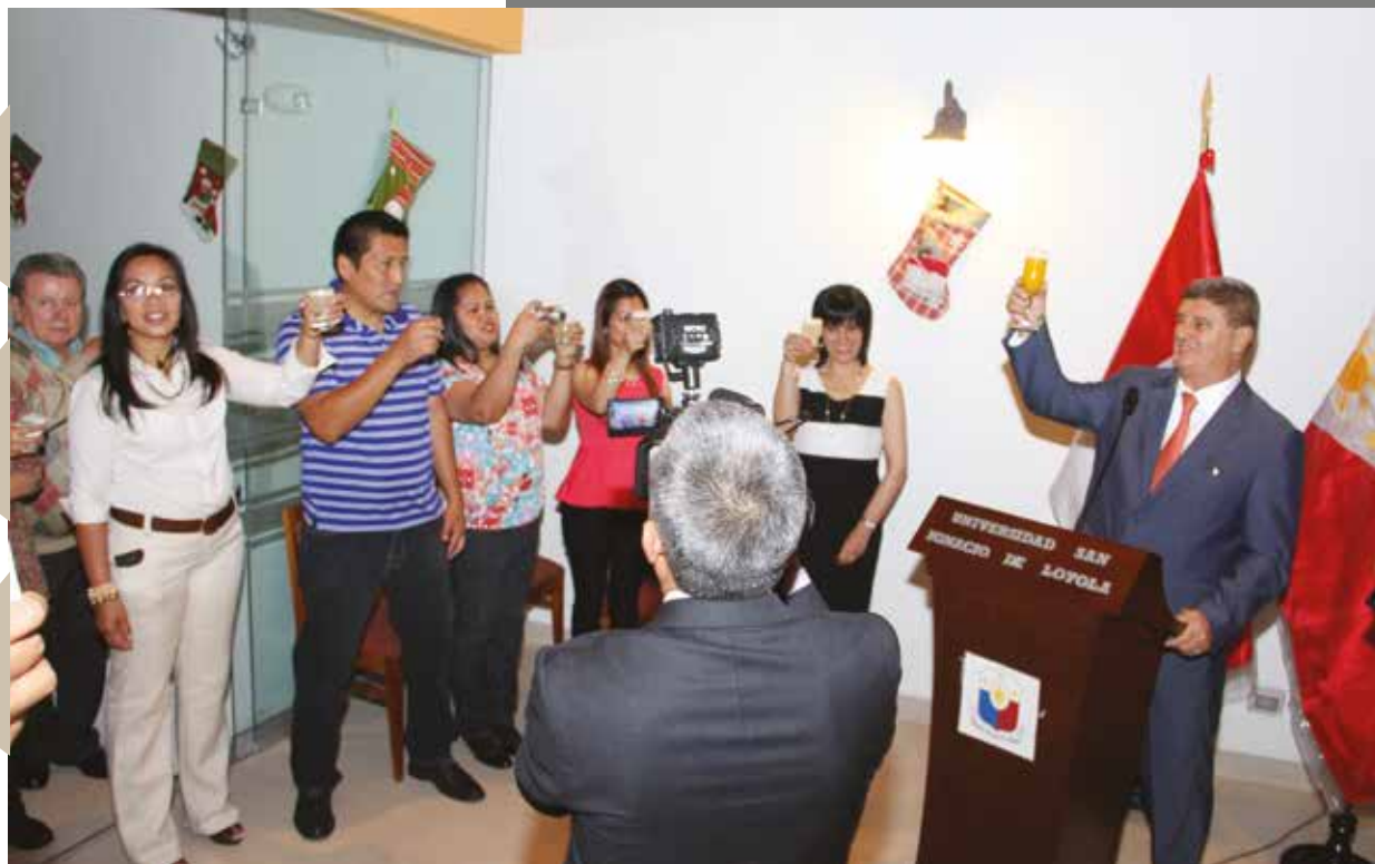
17 de diciembre de 2014 – Un brindis por la Navidad.