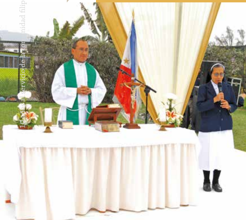
13 de junio de 2009 – Peticiones ofrecidas en la liturgia.

La comunidad filipina fue invitada a celebrar el 111° Aniversario de la Independencia de Filipinas el 13 de junio de 2009 en las instalaciones de la Universidad San Ignacio de Loyola en Huachipa. Cerca de 90 miembros de la comunidad filipina en el Perú asistieron a este evento.