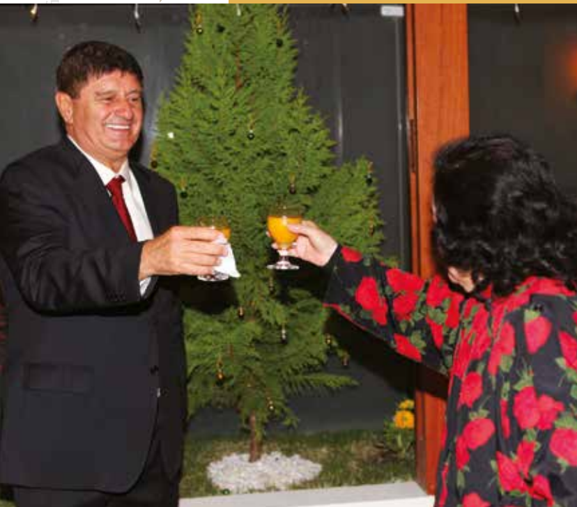
20 de diciembre de 2013 – Brindando por la Navidad.