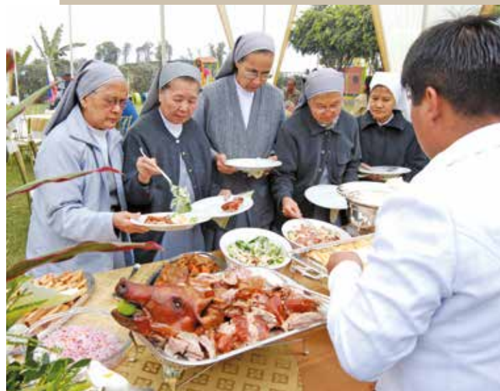
13 de junio de 2009 – Almuerzo ofrecido para la celebración del Día de la Independencia.