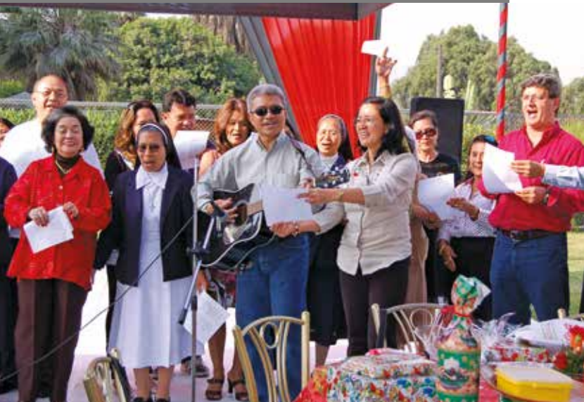
15 de diciembre de 2007 – Todos los miembros de la comunidad filipina cantaron villancicos con gran entusiasmo.