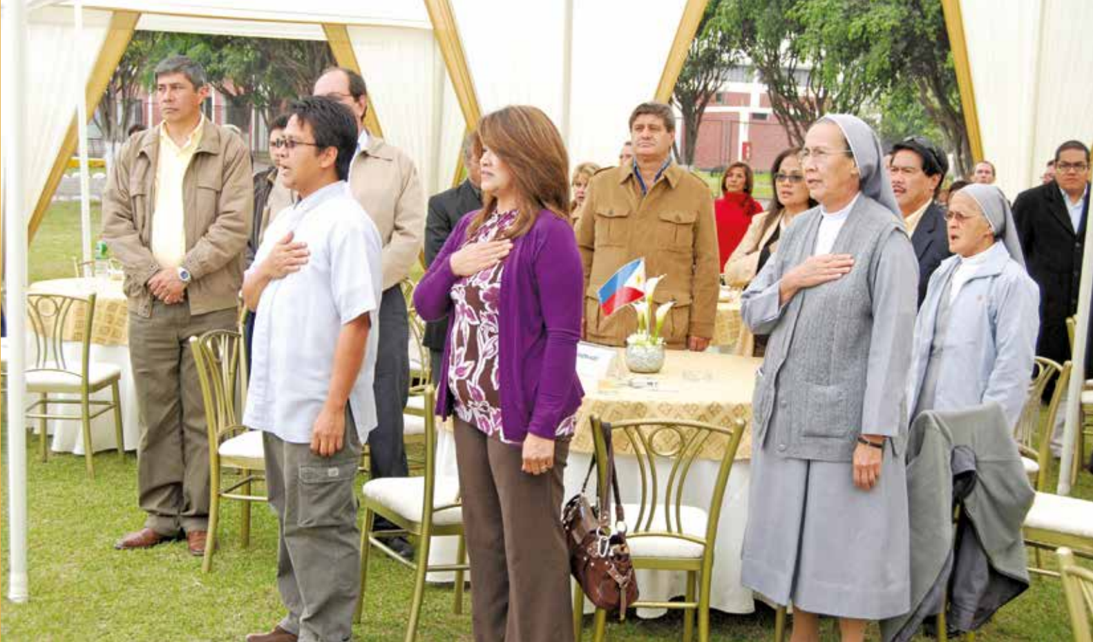
13 de junio de 2009 – Miembros de la comunidad filipina entonando el himno nacional.