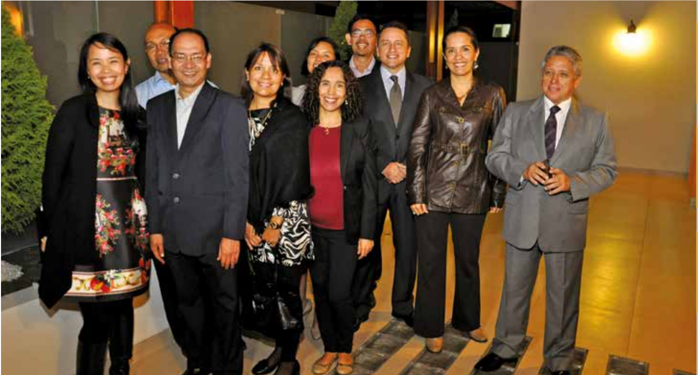
12 de junio de 2015 – Equipo de EDC Peru Holdings durante nuestra celebración por el Día de la Independencia.