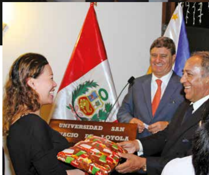
17 de diciembre de 2014 – Intercambio de regalos navideños.

Treinta y nueve ciudadanos filipinos residentes en el Perú se beneficiaron con la renovación de sus pasaportes. Este Consulado General Honorario brindó asistencia para la realización de estos servicios en su local de Miraflores.