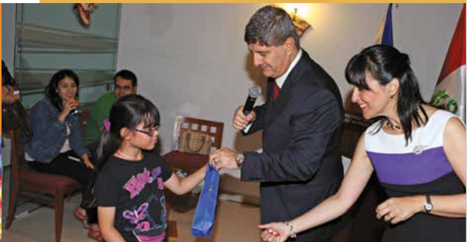
20 de diciembre de 2013 – Intercambio de regalos navideños.