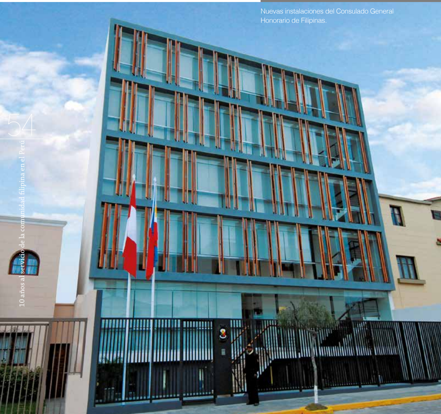
Nuevas instalaciones del Consulado General Honorario de Filipinas.