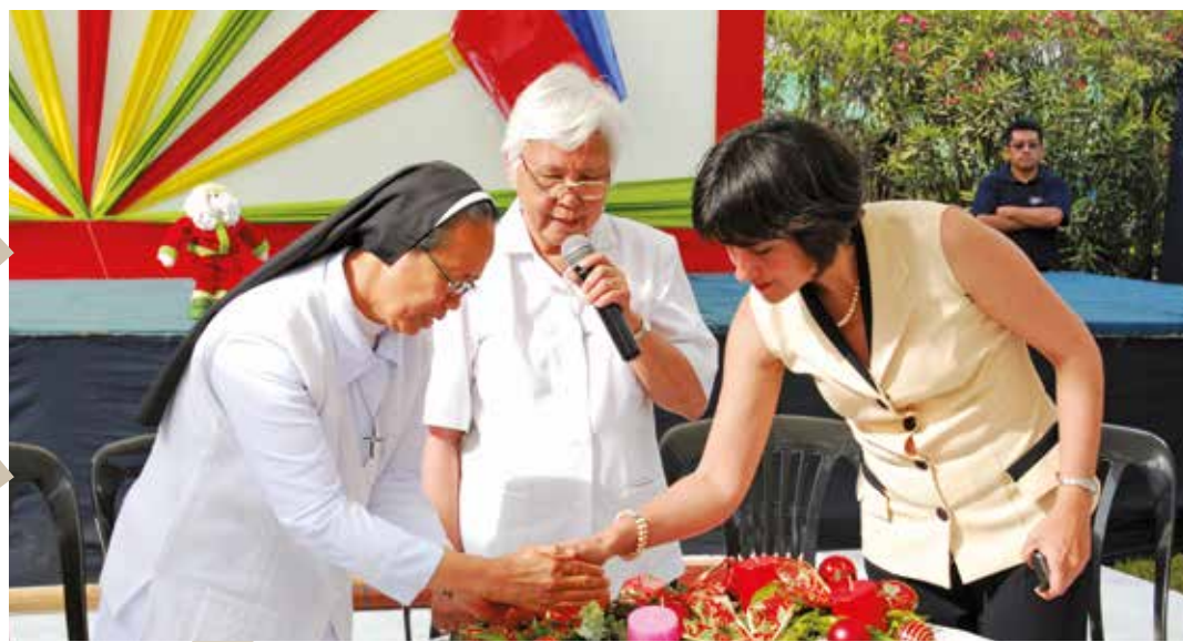
6 de diciembre de 2009 – Ceremonia de encendido de la vela de Adviento.