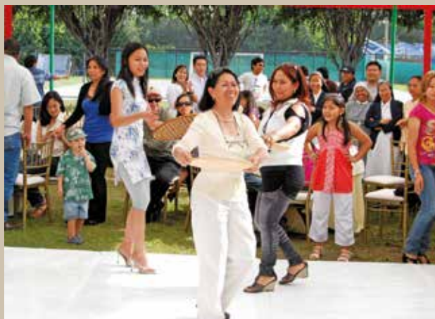
6 de diciembre de 2009 – Miembros de la comunidad filipina bailando la danza del Salakot.