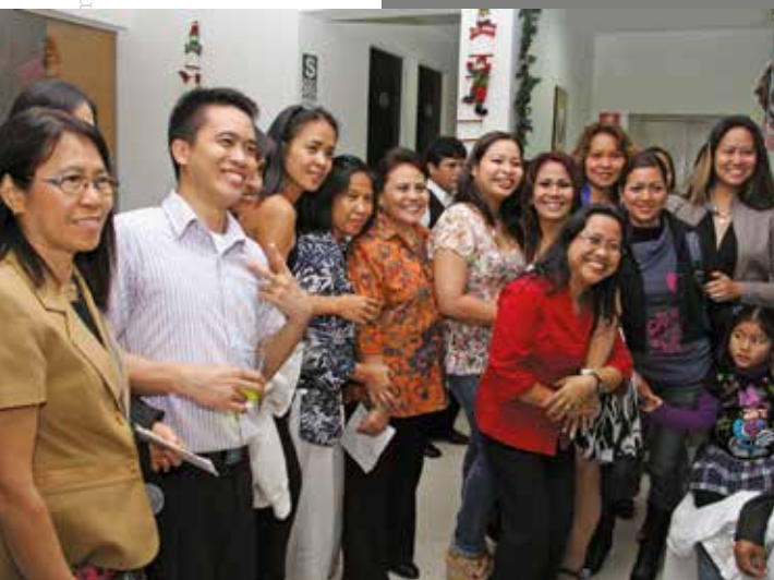
20 de diciembre de 2012 – Miembros de la comunidad filipina que estuvieron en nuestra celebración navideña.