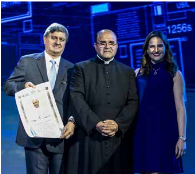
•• El padre Emerson, amigo entrañable de la USIL, transmitió el saludo del papa Francisco por el quincuagésimo aniversario de nuestra organización educativa. El Sumo Pontífice hizo llegar su bendición a la familia corporativa y estudiantil de San Ignacio de Loyola.