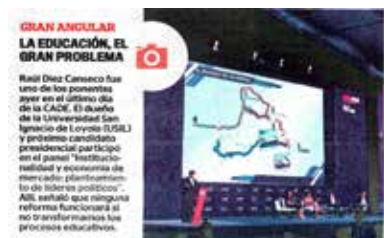
» Diario Correo