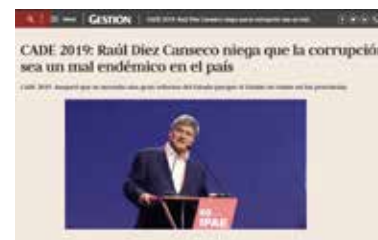
» Portal Diario Gestión