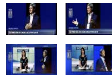
» Canal N