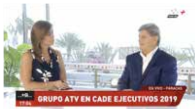
» Portal ATV Noticias