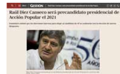
» Portal Diario Gestión