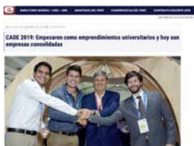
» Portal Noticia Educación en Red