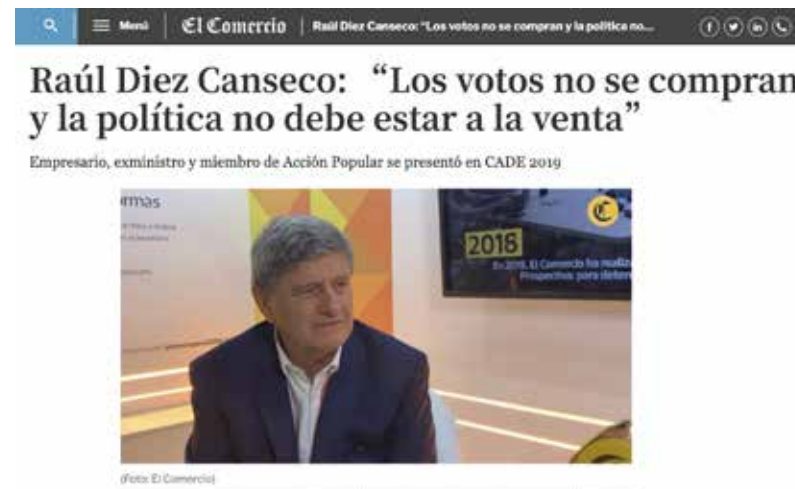
» Portal Diario El Comercio