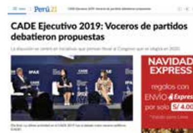
» Portal Diario Perú 21